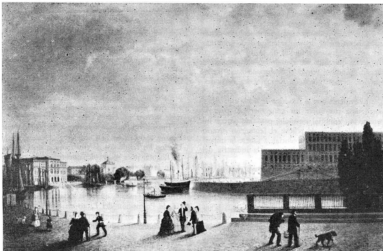
ESTOCOLMO EN 1874: VISTA DE LA "CORRIENTE". CUADRO AL OLEO DE ALF BLOMBERGSON. ENTRE EL PALACIO REAL A LA DERECHA Y EL MUSEO NACIONAL A LA IZQUIERDA SE VE UNO DE LOS VAPORCITOS DE QUE HABLA CUERVO EN SU CARTA DEL 2 DE NOVIEMBRE DE 1878.

3 Hay un valioso estudio sobre Francisco de Miranda y Escandinavia: Miranda i Sverige och Norge 1787. General de Mirandas dagbok från hans resa september-december 1787. Utgiven med en levnads-teckning och översättning från det spanska originalet av Stig Rydén, kommenterad av Bjarne Dietz, Stig Roth o. Sigurd Wallin. Con un apéndice en español. Editado en colaboración con la Academia Nacional de la Historia de Venezuela. Estocolmo, 1950.