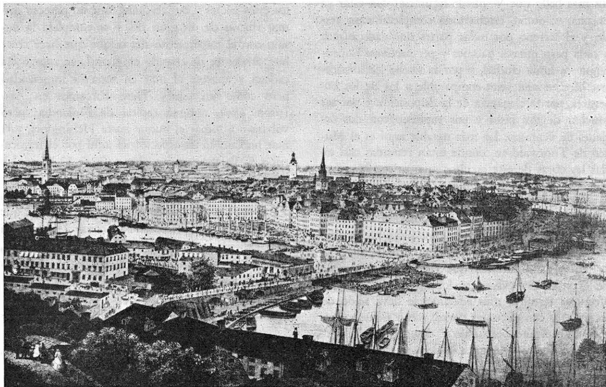
ESTOCOLMO EN 1863: VISTA GENERAL DE LA CIUDAD DESDE "MOSEBACKE", QUE ES UNA DE LAS "COLINAS DONDE PARECE QUE SE VAN TREPANDO LAS CASAS", SEGUN DICE CUERVO EN SU CARTA DEL 2 DE NOVIEMBRE DE 1878 A D. MIGUEL ANTONIO CARO.