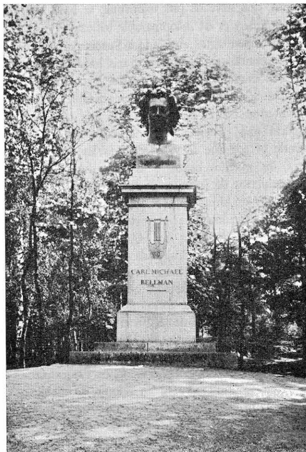
EN EL PARQUE DE DJURGÅRDEN EN ESTOCOLMO SE LEVANTA EL BUSTO DE CARL MICHAEL BELLMAN, «EL POETA QUERIDO DEL PUEBLO SUECO».

de suerte que se ve casi todo lo que él trabajó; en todas se echa de ver una perfecta concepción de la belleza ideal, a lo cual agrega mano diestra y mucha chispa; entre sus bajo relieves hay algunos como las edades del amor, que son verdaderas anacreónticas. Al ver su mobiliario y los cuadros de su propiedad, que todo esto se halla en el museo, se lleva los ojos entre los últimos un fraile de distinguidísima figura: es Kuchler, el pintor más eminente de Dinamarca, que, convertido al catolicismo, tomó la cogulla y murió en Roma. En la iglesia de Nuestra Señora tampoco hay otra cosa que esculturas de Thorwaldsen o de sus discípulos bajo su dirección: el Salvador, admirable, en el altar mayor, y en el contorno del presbiterio, en bajo relieve, la última cena y el bautismo, ambos bellísimos, pero sobre todo el último, donde enamoran por su pureza dos ángeles que tienen las vestiduras del Redentor. Otro ángel de tamaño natural y con una concha en las